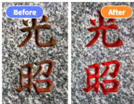
文字塗料入れ 300円×文字数（消費税別）