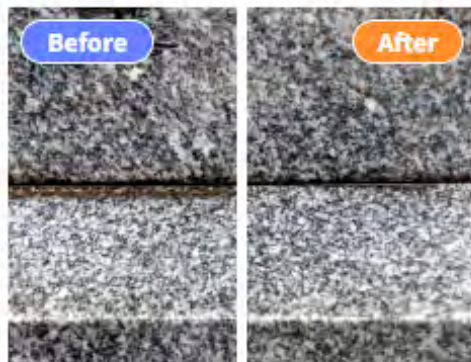
水垢取り 3,500円～（消費税別）